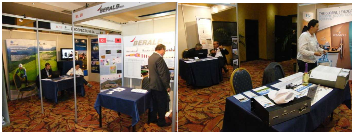
Prospectiuni és a Beralb standjai

Prospectiuni (Románia): A társasággal már a tavalyi Koppenhágai EAGE kongresszuson megismerkedtünk. Tiranában ez a kapcsolat tovább mélyült, felvetődött közös kutatási tevékenység, karotázs mérés, melyekre ígéretük szerint hamarosan árajánlatot kérnek.