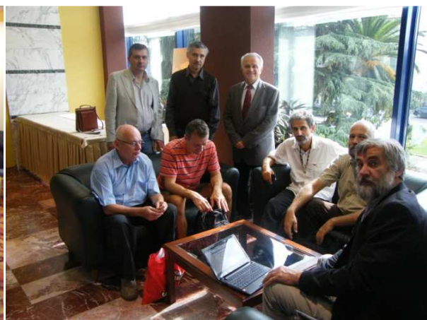
Néhány kép a magyar delegációkról: Geoport Kft., MFGI. (Budapest) GGKI. (Sopron), Karotáz s Kft. (Pécs)