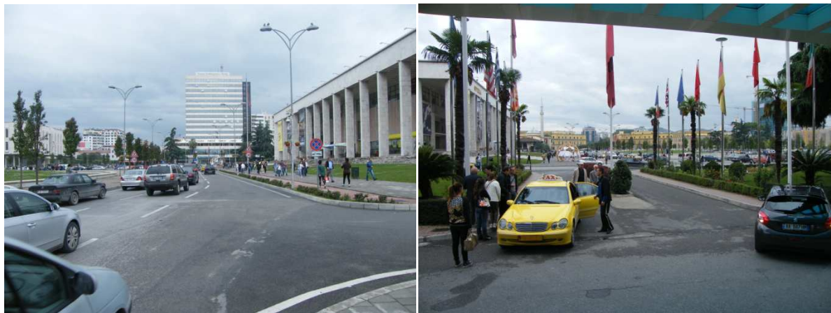
Helyszín: Tirana International Hotel

A Dél-Dunántúli Környezetipari Klaszter és a Karotázs Kft. képviseletében 6 fő vett részt Tiranában, 2013. október 07 – október 10. között rendezett BGS-en (7th Congress of the Balkan Geophysical Society). Az előkészítés során a Karotázs Kft. erre az alkalomra is saját posztert, kiadvány, szóróanyagokat készített. Feladatunk volt – az általános kiállítói feladatok mellett – a munkatársak egy részének és a kiállított eszközök helyszínre és a helyszínen való szállítása, stand berendezése, üzemeltetése, kapcsolattartás. A BGS-en kiállítottuk a saját fejlesztésű új karotázs berendezésünket és a sokcsatornás komplex impedancia mérő műszerünket. A standunkon a Dél-Dunántúli Környezetipari Klaszter angol nyelvű bemutatkozó anyagát is kitettük. A szervezési munka egy részét a TENSI Kft. Pécs végezte!