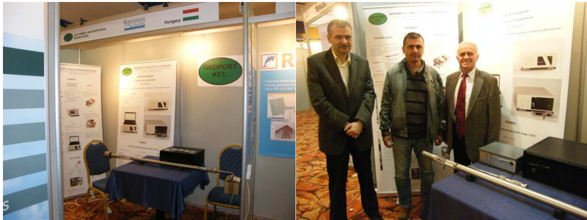
Geoport Kft. standja